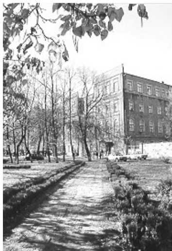
ЗОНАЛЬНАЯ НАУЧНАЯ БИБЛИОТЕКА Воронежского госуниверситета

394036 Россия, г. Воронеж, пр. Революции, 24 Тел.: /473/ 253-11-76 251-26-77